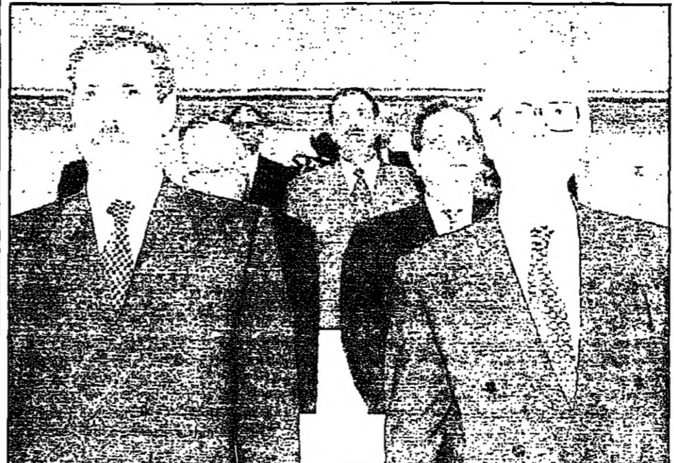
الوزراء غير الطراونة وبناش طاهر كنعاني ولطفاً بلقاء الزواري الذي حضره من جلسة البرلمان أمس